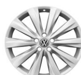
Легкосплавные колеса "Las Minas" 6J x 16 Опционально для Status и Exclusive