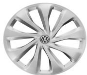
Стальные колеса 6J x 15 Стандартно для Origin и Respect