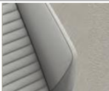
Комбинированная обивка сидений из искусственной замши/кожи светло-серого цвета