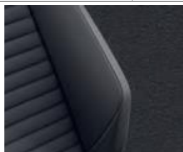
Комбинированная обивка сидений из искусственной замши/кожи черного цвета