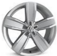
Легкосплавные колесные диски Istanbul 7J x 17 стандартно для Business