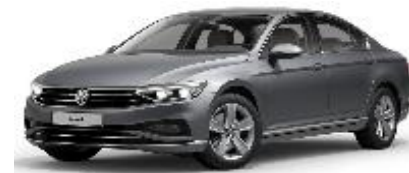
Серебристый «Pyrit», металл (K2K2)