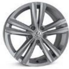
Легкосплавные колесные диски Sebring 7J x 17