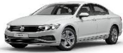
Белый «Орех», премиум перламутр (0R0R)