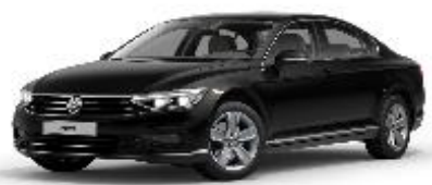
Чёрный «Deer», перламутр (2T2T)