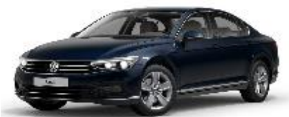
Синий «Aquamarine», металл (8H8H)