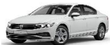
Белый «Pure» (0Q0Q)