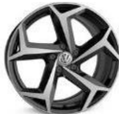
Легкосплавные колесные диски Bonneville 8J x 18