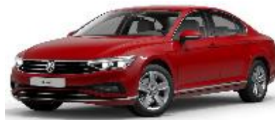
Красный «Tornado» (G2G2)