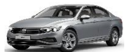
Серебристый «Reflex», металл (8E8E)